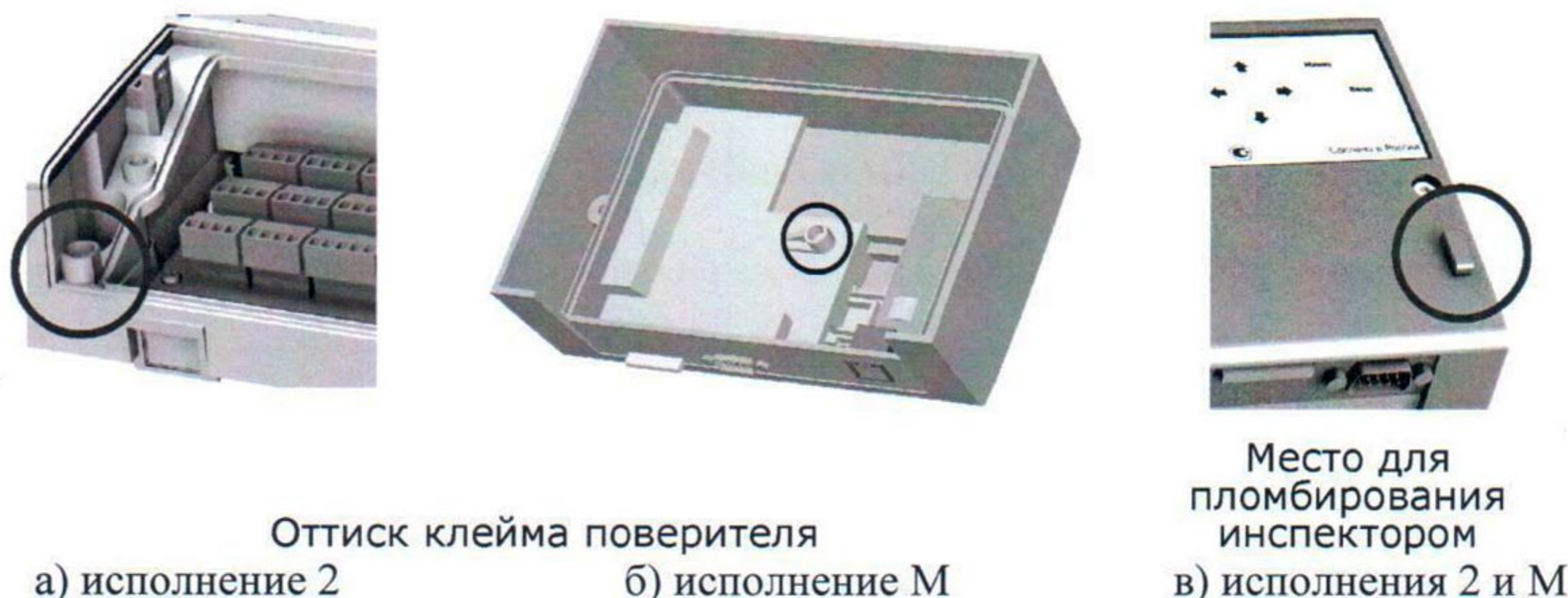
Рисунок 2 - Схема пломбировки тепловычислителя

В целях предотвращения доступа к узлам регулировки и настройки, а также к элементам конструкции предусмотрены места нанесения знака поверки - оттиска клейма поверителя на специальной мастике, расположенной в чашечке винта крепления по рисунку 2.